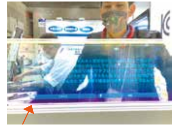
話した言葉がすぐ文字になって表示される！

役所の窓口の亚克力板に透明スクリーンを貼付し、訪れた住民とのやり取りを文字として表示するシステムを体験しました。耳が聞こえづらい方や高齢者らはその字幕を見ながら市職員と会話できます。コロナ下で窓口などでは亚克力板越しやマスク着用の会話となっていますが、利用者から「声が聞きづらい」などの意見が上がっています。市の窓口においてもこうしたシステムをぜひ導入していただきたいものです。